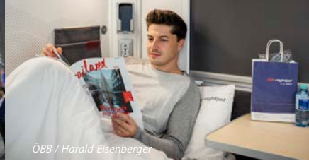
ÖBB / Harald Eisenberger