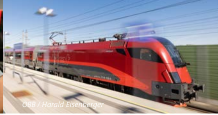
ÖBB / Harald Eisenberger