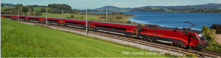
ÖBB / Harald Eisenberger