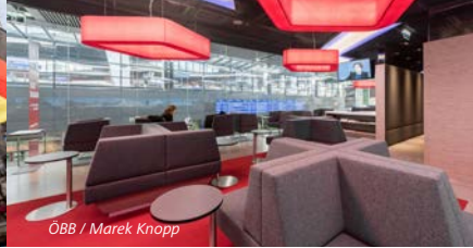
ÖBB / Marek Knopp