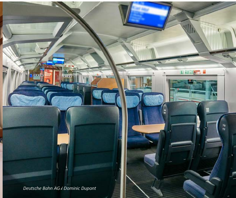
Deutsche Bahn AG / Dominic Dupont