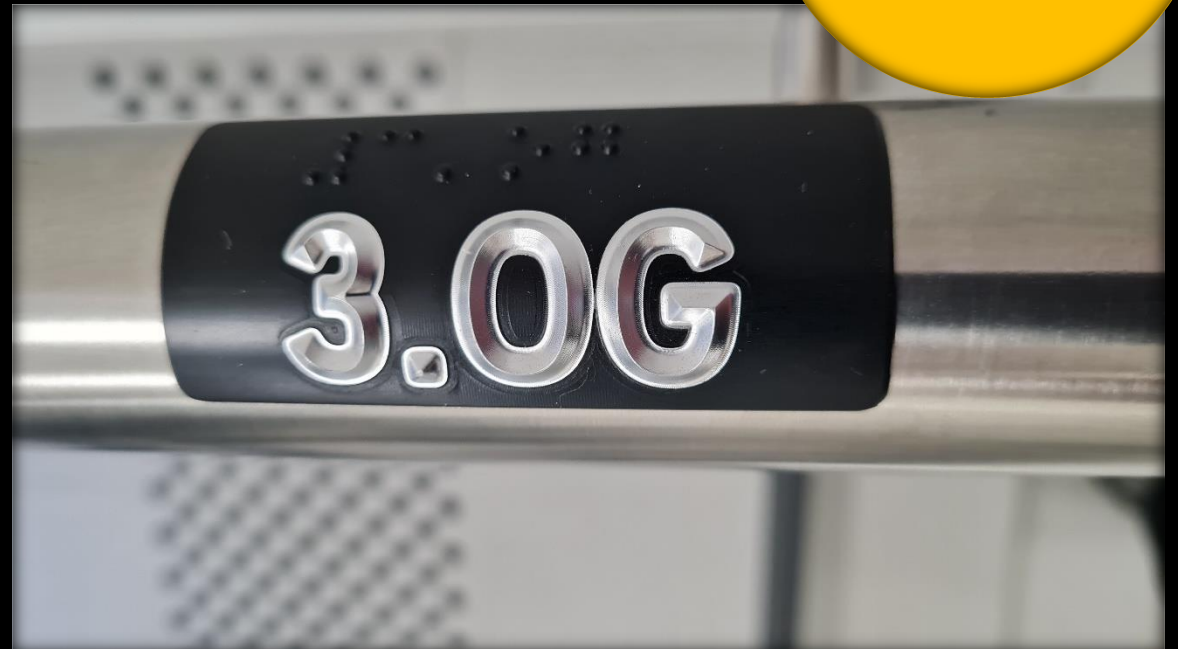
Neue Innovation und Produktion – Kontrastreich!