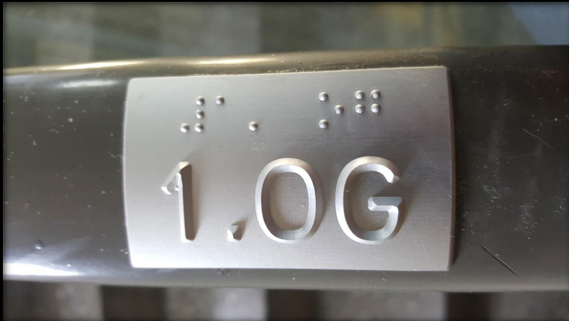
Marktübliche taktile Kennzeichnung