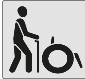
Menschen mit Gehbehinderung / People with walking disabilities