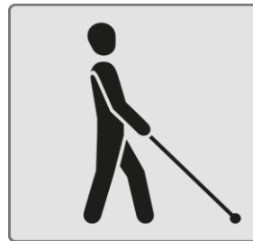
Blinde Menschen / Blind people