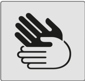
Gehörlose Menschen / Deaf people