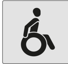
Rollstuhlfahrer / Wheelchair users