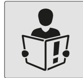
Menschen mit kognitiven Beeinträchtigungen / People with cognitive impairments