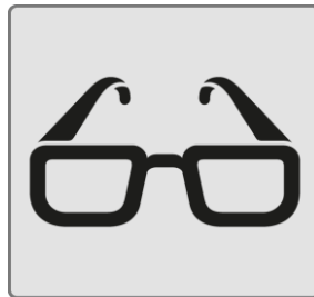
Menschen mit Sehbehinderung / People with visual impairments