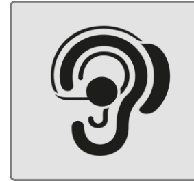
Menschen mit Hörbehinderung / People with hearing impairment