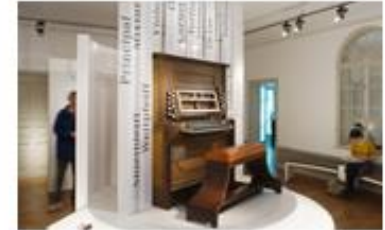
Die Orgel im Zentrum