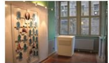
Dem Familienleben auf der Spur