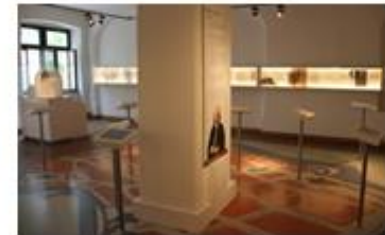
Bach in Leipzig